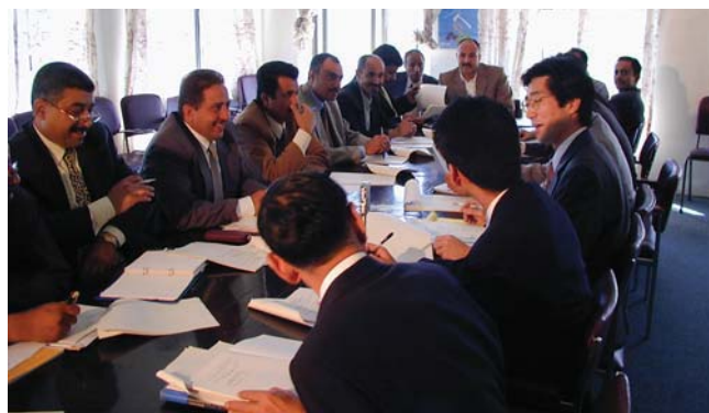
Yémen: Comité gouvernemental du Japon et du Yémen