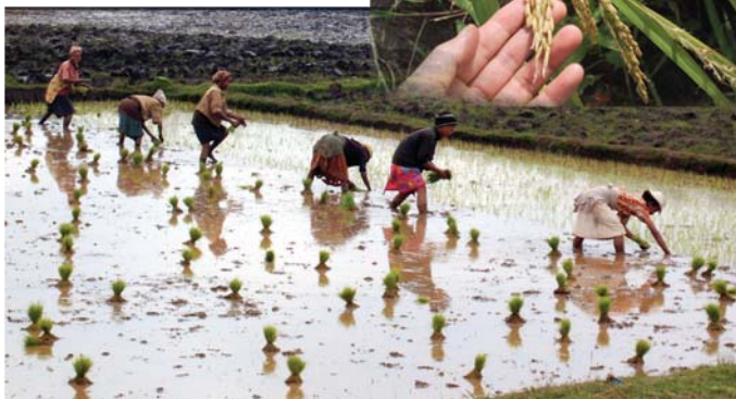
Madagascar: Scène du repiquage. La consommation du riz par tête du Madagascar est la plus élevée du monde