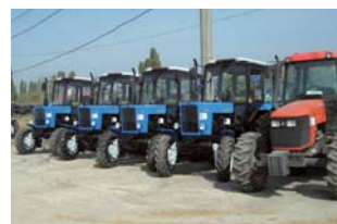
Tracteurs fournis par le JICS

Tout d'abord, un total de 296 tracteurs fournis et livrés ont été vendus dans le pays, et sur la base des revenus de ces ventes, des tracteurs supplémentaires ont pu être de nouveau fournis et vendus. En répétant ces opérations de fourniture et de vente, 1 700 tracteurs, à savoir six fois plus que le nombre de tracteurs fournis à l'origine et un total de 2 135 unités de matériels agricoles, dont des moissonneuses-batteuses, ont été approvisionnés jusqu'en 2005.