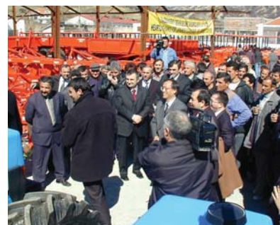
Albanie: Cérémonie de remise de machines agricoles