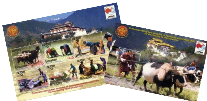
Bhoutan: Timbres commémoratifs du 20ème anniversaire de l'aide à l'augmentation de la production alimentaire destinée au Bhoutan