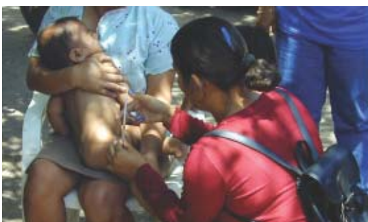
Nicaragua: Vaccination d'un bébé