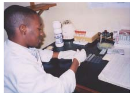
Les paquets d'examen VIH fournis sont utilisés surtout pour le CTV et l'examen du sang de transfusion dans les hôpitaux