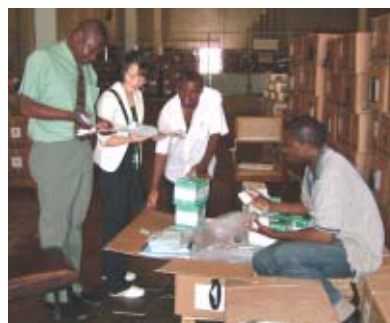
Zambie: Agent du JICS qui vérifie avec les officiers du Ministère de la Santé Publique, les paquets de traitement des maladies infectieuses arrivés