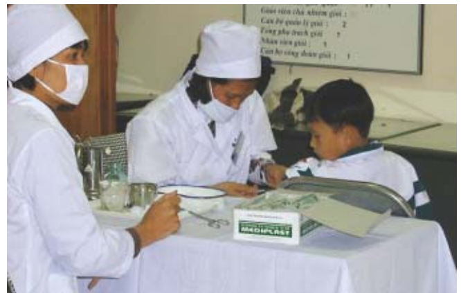
Viêt-nam: Vaccination contre la rougeole d'un enfant

Comme la plupart des dons pour la lutte contre les maladies infectieuses sont effectués pour des cas relativement urgents et que les périodes de validité des vaccins et des médicaments sont également limitées, la rapidité et l'exactitude sont requises pour la gestion des projets. Le JICS, en tant qu'organisme de préparation, contribue au développement du domaine de la santé dans les pays en voie de développement.