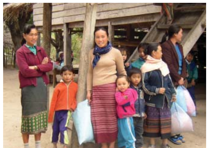
Laos: Villageois qui ont apporté leurs moustiquaires pour la macération médicamenteuse