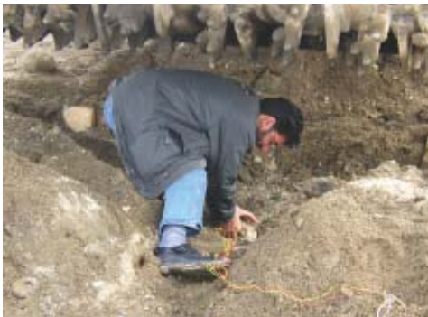
Projet d'étude et développement des matériels pour le soutien aux activités de déminage en Afghanistan: membre de l'équipe qui met un explosif pour l'essai de la résistance à l'explosion

Depuis 2001, conformément au contrat conclu avec le gouvernement du pays en voie de développement bénéficiaire, le JICS gère correctement les fonds fournis dans le cadre de la coopération financière non-remboursable pour aider les activités de recherches sur les problèmes des pays en voie de développement et les activités de développement. Le JICS déploie aussi les activités de coordination et de support envers les chercheurs ou les fabricants du Japon et du pays bénéficiaire pour assurer le bon déroulement de leurs activités.