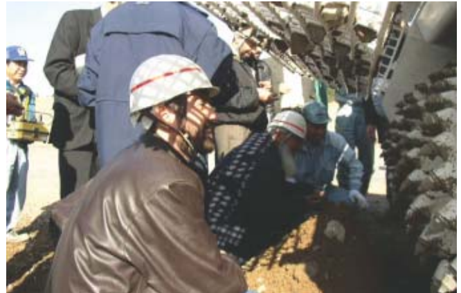
Projet d'étude et développement des démineurs pour l'Afghanistan: intéressés afghans qui ont visité le Japon pour observer un essai du démineur