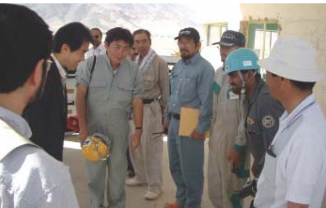
Projet d'étude et développement des matériels pour le soutien aux activités de déminage en Afghanistan: M. Aizawa, Vice-ministre des Affaires Etrangères du Japon, a visité le site de l'essai et rencontré les intéressés afghans