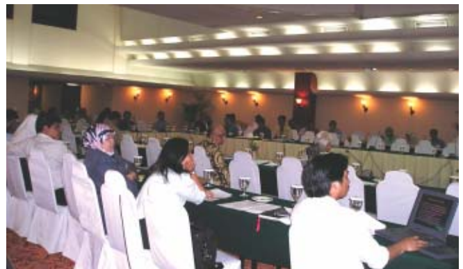
Deuxième projet d'études pour la décentralisation de l'Indonésie: atelier EXIT organisé à Bandung