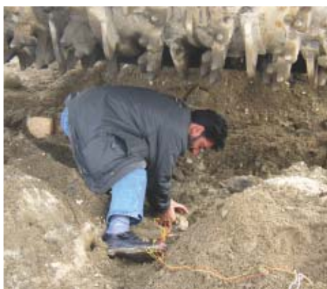
Programa de Investigación y Desarrollo de Equipos para el Apoyo de Actividades de Eliminación de Minas en Afganistán — Personal local colocando explosivos debajo del eliminador para una prueba de resistencia explosiva

Desde el Año Fiscal 2001, conforme a los contratos con los gobiernos de los países en desarrollo, JICS administra fondos no reembolsables destinados a actividades de investigación y resolución de problemas varios, enfrentados por sus gobiernos. Al mismo tiempo asiste y coordina para una empática relación mutua entre investigadores y fabricantes de ambos países durante la ejecución de sus tareas.