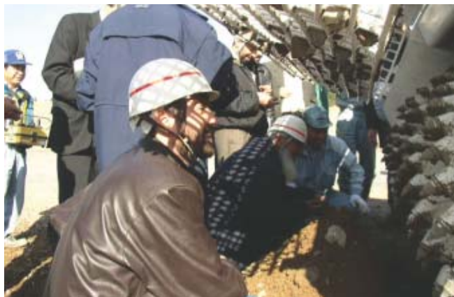
Programa para la Investigación y Desarrollo de Equipo Eliminador de Minas en Afganistán — Partes interesadas de Afganistán visitaron Japón para observar un prototipo de eliminador de minas