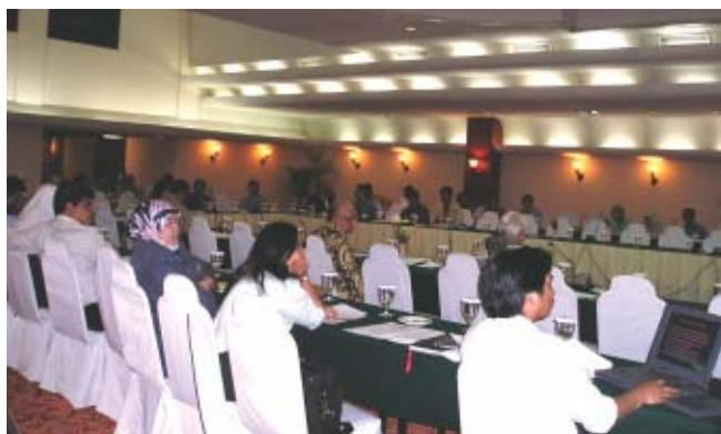
Programa de Investigación para la Segunda Descentralización Administrativa de Indonesia — Visita del Taller EXIT celebrado en Bandon