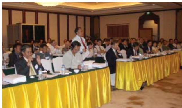
Escena del Simposio Exit celebrado en Yakarta. Después de las presentaciones por los investigadores se intercambian opiniones entre los participantes mediante un foro

Los simposios y talleres tuvieron muchos participantes del gobierno central, así como de los gobiernos regionales, organizaciones internacionales, ONG's, medios de comunicación, universidades y otros estamentos interesados en materias de gobierno, quienes intercambiaron opiniones. Adicionalmente, los investigadores de ambos países presentaron recomendaciones sobre la política de descentralización en el resultado de sus investigaciones; tales recomendaciones fueron resumidas en un folleto en inglés e indonesio para la distribución entre las partes interesadas de los gobiernos regionales.