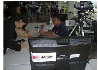
Termógrafos y otro equipo en uso en la Central de Autobuses del Norte en la Ciudad de México

JICS, después de haber firmado un acuerdo de agente con la Embajada Mexicana en Japón, el 3 de mayo de 2009, acerca de la provisión de termógrafos, llevó a cabo las adquisiciones, gestionó los fondos proporcionados, y entregó los termógrafos y equipo periférico en el Aeropuerto Internacional de la Ciudad de México el día 7 de Mayo.