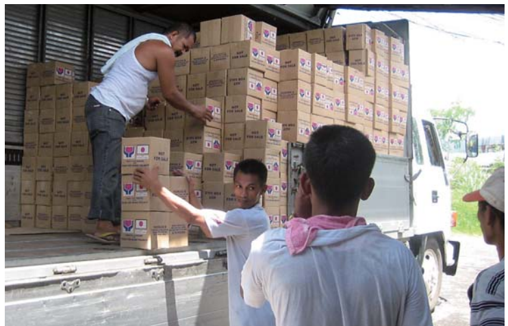
Personas descargan paquetes de alimentos adquiridos con los fondos de AOD proporcionados por Japón. Estos paquetes de comida se han destinado al Proyecto 'Food for Work' (alimentos para trabajar), un proyecto que el gobierno local está llevando a cabo.

Filipinas: Cooperación Financiera No Reembolsable para Emergencias para los Daños de Corrimientos de Tierra Causados por el Tifón "Reming" en el Sur de la Isla Luzón (año fiscal 2006)