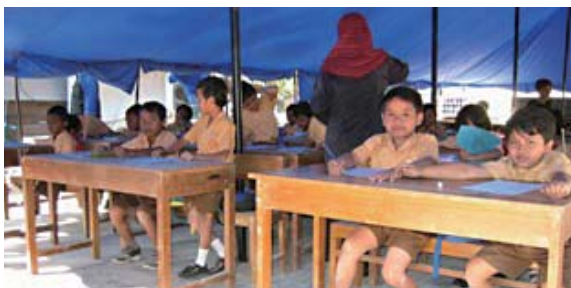
Los niños reciben clase en una tienda de campaña proporcionada por Japón.

Indonesia: Cooperación Financiera No Reembolsable para Emergencias para las Áreas Afectadas por el Terremoto en Yogyakarta y Java Central (año fiscal 2006)