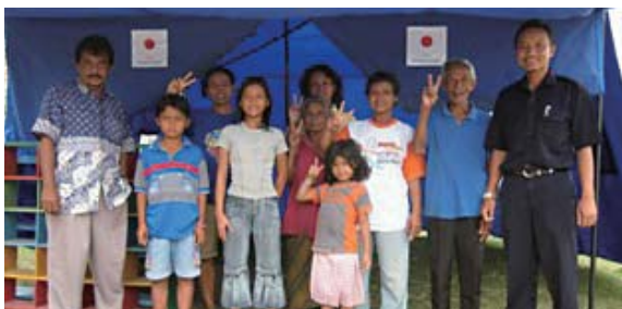
Familia afectada utiliza una tienda de campaña proporcionada por Japón.

Filipinas: Cooperación Financiera No Reembolsable para Emergencias para los Daños de Corrimientos de Tierra Causados por el Tifón "Reming" en el Sur de la Isla Luzón (año fiscal 2006)