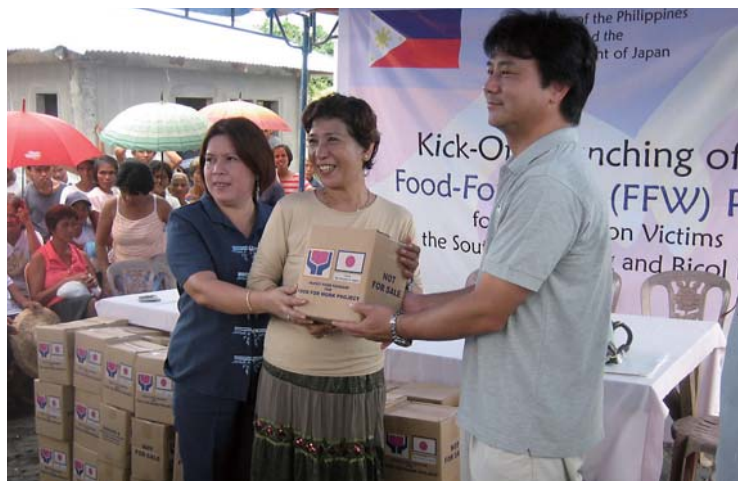
Ceremonia de entrega de los paquetes de alimentos