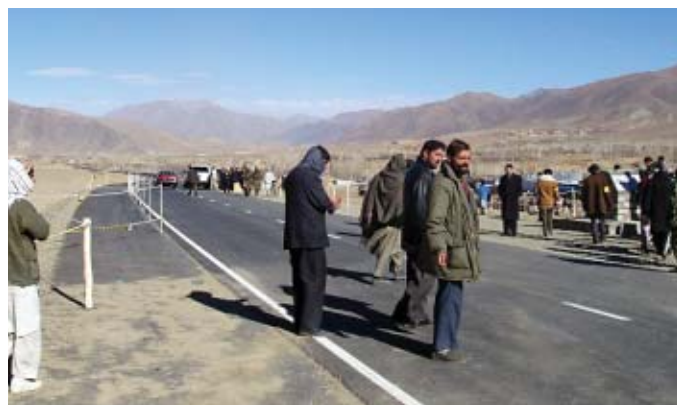
Afghanistan: Route principale Kandahar-Kabul construite dans le cadre du don hors projet.