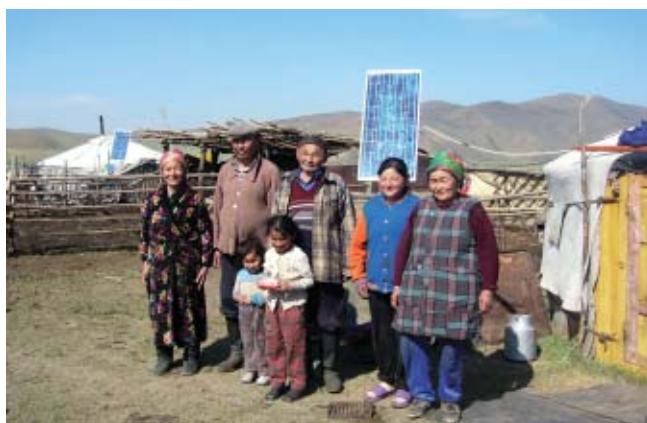
Mongolie: Piles solaires installées dans des habitations traditionnelles

Le fonds constitué par le gouvernement du pays en voie de développement bénéficiaire en monnaie locale équivalent à un certain montant de la valeur de l'équipement fourni dans le cadre de la coopération financière. Ce fonds doit être utilisé en accord avec le gouvernement japonais pour le développement économique et social de ce pays bénéficiaire.