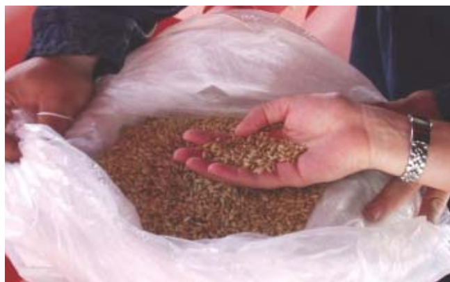
Jordanie: Blé fourni à la Jordanie dont les devises étrangères sont en diminution à cause de la guerre d'Irak