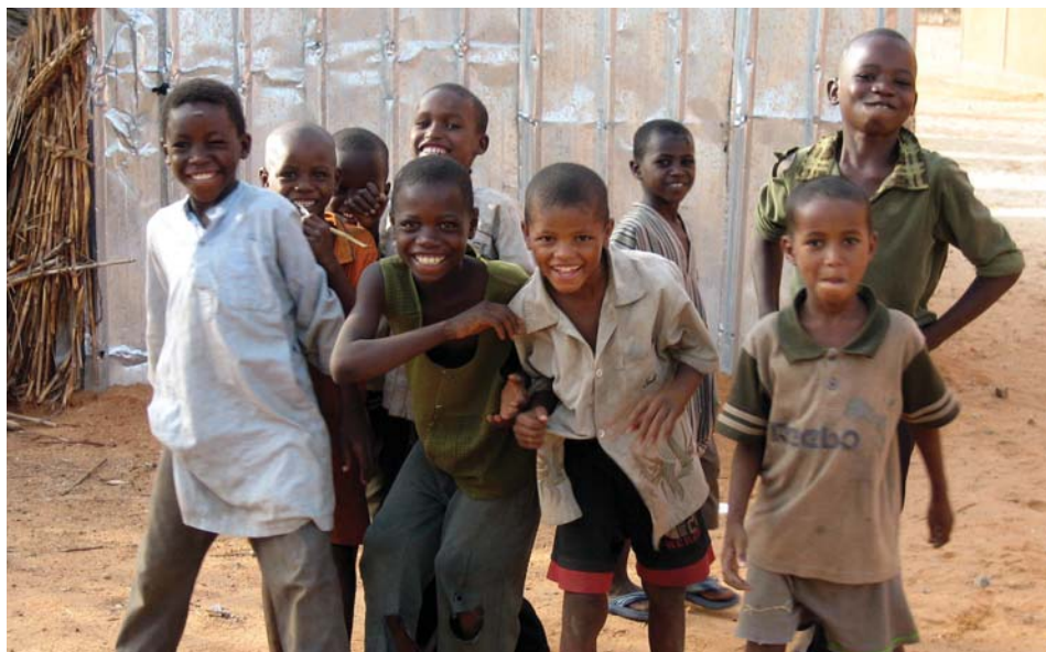
ニジェールー支援対象地域の子どもたち

コミュニティ開発支援無償は、現地事情に即した柔軟な対応が可能となる一方、質の確保のためにさまざまな配慮が求められ、高度な調達監理能力が必要となります。JICSは調達機関として、円滑で効果的な実施をサポートしていきます。