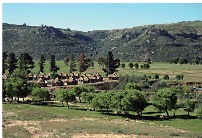
レソトー支援対象地域