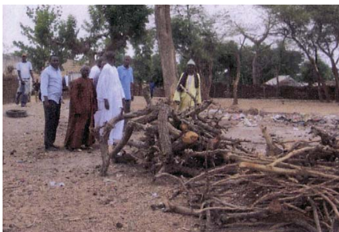
セネガルー夏休み中は取り壊されている木の枝などで作る仮設教室