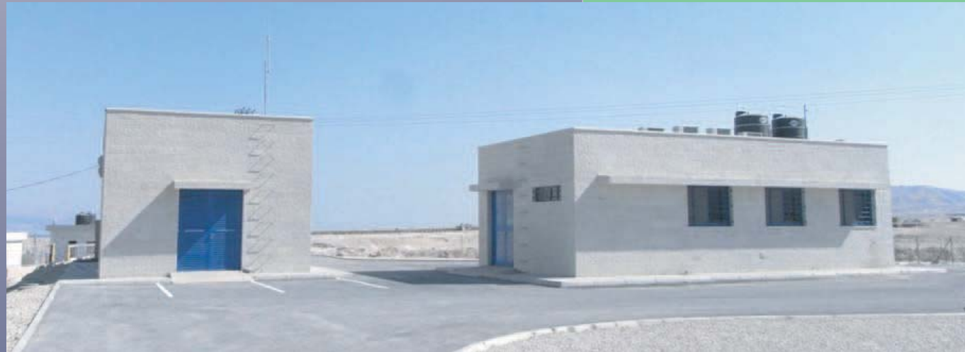
Substation Bldg. & Monitor Bldg.