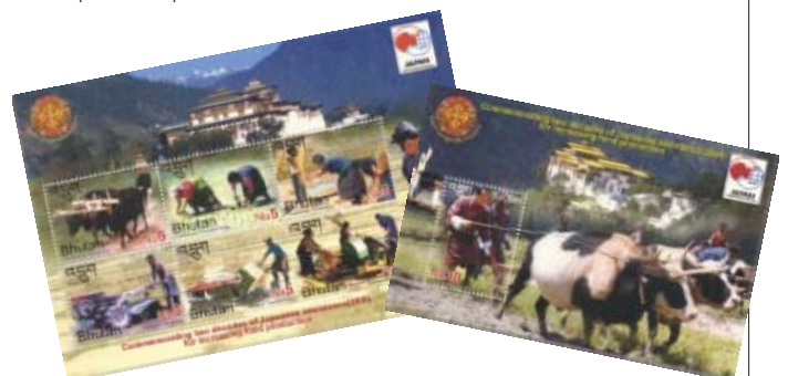
Bután —Estampillas emitidas para la conmemoración del 20º años de la Cooperación Financiera No Reembolsable para el Aumento de la Producción de Alimentos (2KR) hacia Bután