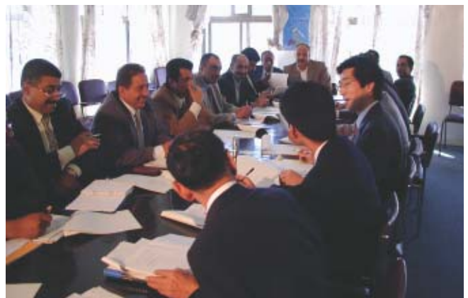
Yemen —El Comité compuesto por oficiales de los gobiernos de Madagascar y Japón

Los gobiernos de los países en desarrollo crean un fondo en moneda local en un banco equivalente al valor de los equipos adquiridos a través de la cooperación financiera no reembolsable. Entonces estos fondos pueden ser utilizados en forma planificada para el desarrollo local económico luego del acuerdo con el gobierno del Japón.