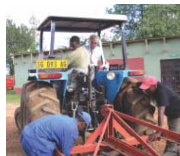
El experto japonés conduce un tractor, ofreciendo asesoría técnica a operarios locales

El Sr. Steven Motsa, sub-secretario del Ministerio de Planificación y Desarrollo Económico hizo los siguientes comentarios con relación al entrenamiento técnico. "Agradecemos al gobierno japonés por esa cooperación a largo plazo a través de 2KR junto con los esfuerzos del gobierno de Swazilandia para aliviar pobreza. Esperamos que luego del entrenamiento técnico, los tractores disminuyan averías y se pongan en buen uso para cultivar más campos, aumentando la producción de maíz, y finalmente contribuir a reducir la pobreza del país."