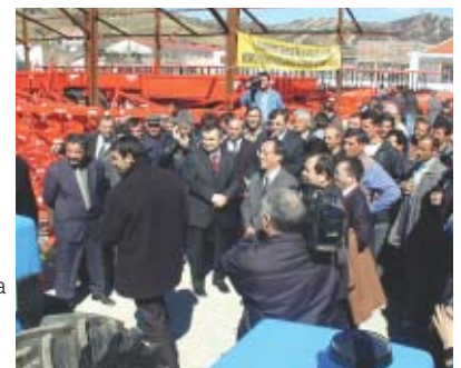
Albania —Ceremonia de entrega para los equipos agrícolas provistos por JICS