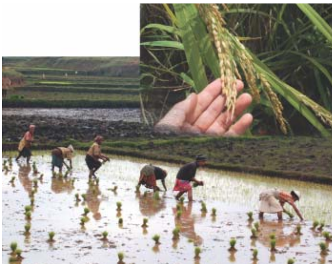
Madagascar —Plantación de arroz. Madagascar tiene el consumo per cápita más alto en el mundo