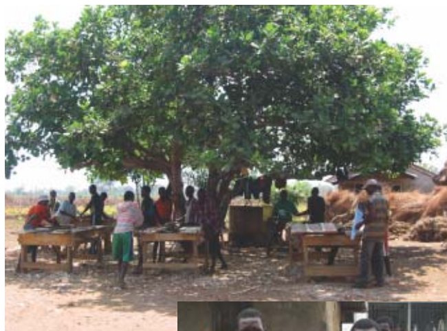
Sierra Leone: Scène de formation professionnelle. La plupart des élèves sont d'anciens soldats