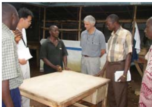
Agent du JICS (gauche) et intéressés de l'aide anglaise (droite) qui écoutent l'explication sur une table fabriquée par les élèves de l'école de formation professionnelle

A la première visite de suivi, on a appris que le soutien donné par le Japon n'était pas bien connu par le peuple sierra-léonais, mais au cours du deuxième suivi, on a remarqué que le peuple était au courant dans toutes les régions visitées. Avec l'augmentation du nombre de gens qui allaient et venaient dans les rues et de boutiques, on a remarqué la contribution de cette aide à la reconstruction de la société communautaire et à assurer une vie stable aux habitants.