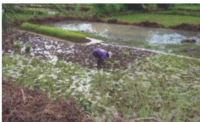
Sierra Leone: Les canaux étant réparés, de l'eau est amenée aux rizières et à la station de pisciculture