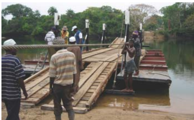
Sierra Leone: Bateau réparé avec lequel le transport des gens et des marchandises a été repris

Depuis 2002, conformément au contrat conclu avec le gouvernement du pays en voie de développement bénéficiaire, le JICS assure, en tant qu'organisme de gestion de la réalisation, la gestion des fonds et déploie ses activités de gestion et de soutien selon le type des programmes.