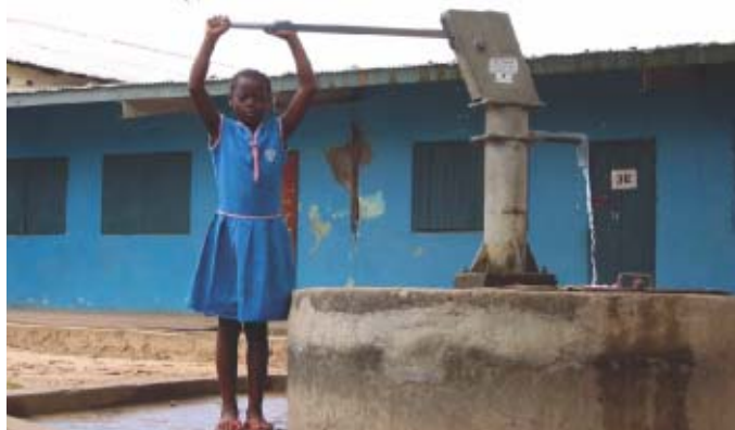
Sierra Leone: Fille qui puise de l'eau à un puits construit dans le cadre de l'aide