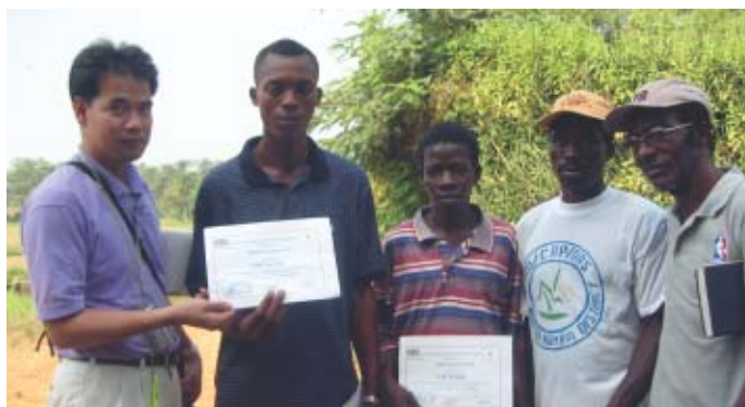
Elève avec le Certificat de fin de formation à la main. Sur le Certificat, on voit la marque des drapeaux du Japon et de l'Angleterre