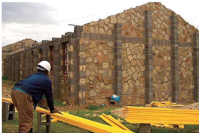
Lesotho Construction d'une école