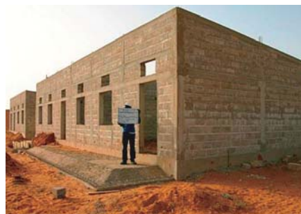
Construction d'une école (Achèvement de la construction de murs)

Cependant, la réalisation de cet objectif a été compromise en raison de problèmes financiers. Le gouvernement japonais a alors décidé d'apporter son soutien au Sénégal via l'aide non remboursable pour le développement des communautés. Au cours de ce projet de soutien, la mise en place des équipements scolaires sera prévue dans 68 écoles primaires et collèges au maximum situés dans les 5 régions occidentales (Kaolack, Louga, Fatick, Dakar et Thiès). Les nombres maximaux à fournir sont définis respectivement comme suit ; 314 salles de classe, 56 bureaux de direction et 288 installations sanitaires. L'environnement d'apprentissage de 16 000 élèves sera ainsi amélioré.