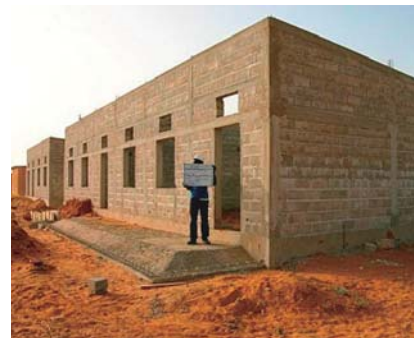
Una escuela en construcción (Paredes terminadas)

Sin embargo, por el hecho de que los problemas financieros han dificultado al país en cumplir el objetivo, el Gobierno del Japón tomó la decisión de proporcionar la Cooperación Financiera No Reembolsable para el Empoderamiento Comunitario en Senegal. Con esta cooperación, se puede esperar un mejoramiento del contorno educativo en cinco regiones del oeste del país (Kaolack, Luga, Fatick, Dakar, Tiès), a través de la construcción y reforma de, como máximo, 314 aulas, 56 despachos para directores y 288 instalaciones de aseo, beneficiando en total a 16 000 alumnos en 68 escuelas primarias y secundarias del país.