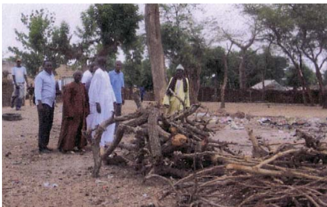
Senegal Aula provisional, una construcción hecha con materiales comunes, como por ejemplo ramas. Durante las vacaciones de verano se desmontan las aulas.