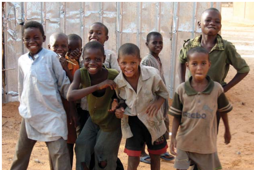
Niger Niños en el lugar donde se realiza un proyecto del Empoderamiento Comunitario.

Ya que la Cooperación Financiera No Reembolsable para el Empoderamiento Comunitario permite tomar medidas flexibles acordes con las situaciones de cada región, y a su vez necesita diversas atenciones para mantener la calidad de ejecución, se requiere una alta capacidad administrativa para la adquisición de bienes y servicios. JICS, como un agente de adquisición oficial del país beneficiario, se compromete a brindar colaboración y ayuda para una implementación eficaz y satisfactoria.