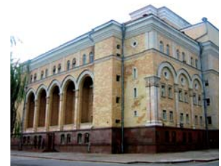
Teatro Académico del Estado Bolshoi denominado por el nombre de Alisher Navoi

Este proyecto se realiza con el fin de proveer los equipos imprescindibles para las actividades teatrales, tales como el equipo de sonido e iluminación, y equipo de grabación y montaje de vídeos. El proyecto facilitará al teatro preparar las actuaciones de manera más eficaz y, a la vez, le posibilitará para presentar las obras a los espectadores con un mejor efecto teatral.