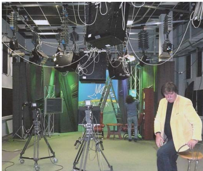
Bulgaria Cámaras de vídeo y micrófonos provistos por Japón se utilizan en un estudio en The National Academy for Theatre & Film Arts (NATFA: Academia Nacional para las Artes Teatrales y Cinematográficas).

Los principales tipos de equipos adquiridos incluyen equipos de sonido e iluminación para teatros, equipos de deporte, equipos para excavación y preservación de áreas arqueológicas, instrumentos musicales, equipos para producción de programas culturales y educativos, materiales relacionados con la enseñanza del idioma japonés, entre otros.