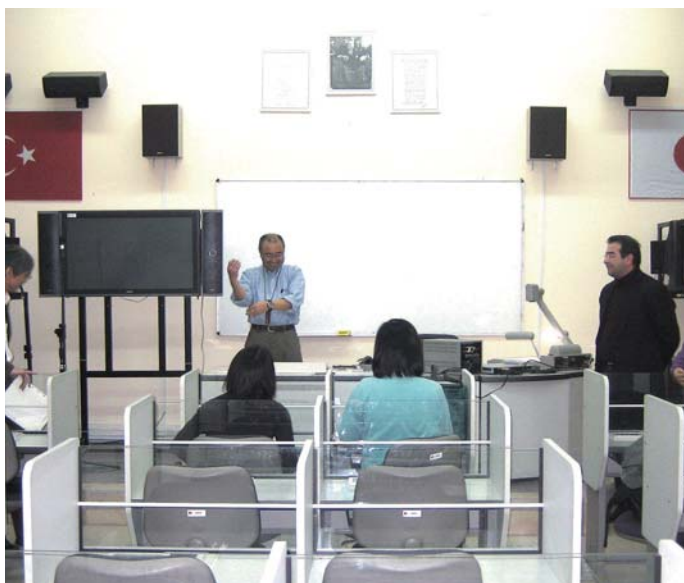
Turquía Equipos de laboratorio lingüístico y audiovisuales provistos por Japón que se utilizan en la Universidad Erciyes.