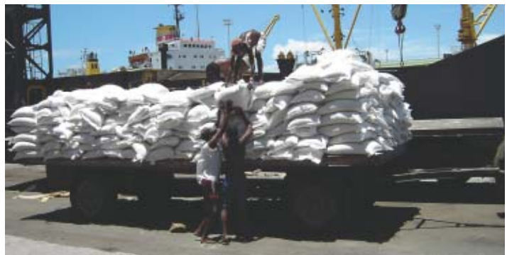
Madagascar: Riz de l'aide venant d'arriver au port

Ce riz sera vendu comme riz gouvernemental moins cher que le prix courant et les bénéfices seront utilisés pour acheter des engrais nécessaires pour la campagne agricole 2005-2006. On peut donc espérer que cette aide contribuera à l'approvisionnement stable en vivres de Madagascar.