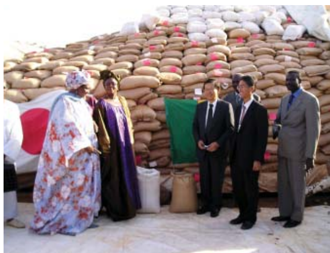
Sénégal: Cérémonie de remise du riz de l'aide entre les responsables des deux gouvernements concernés