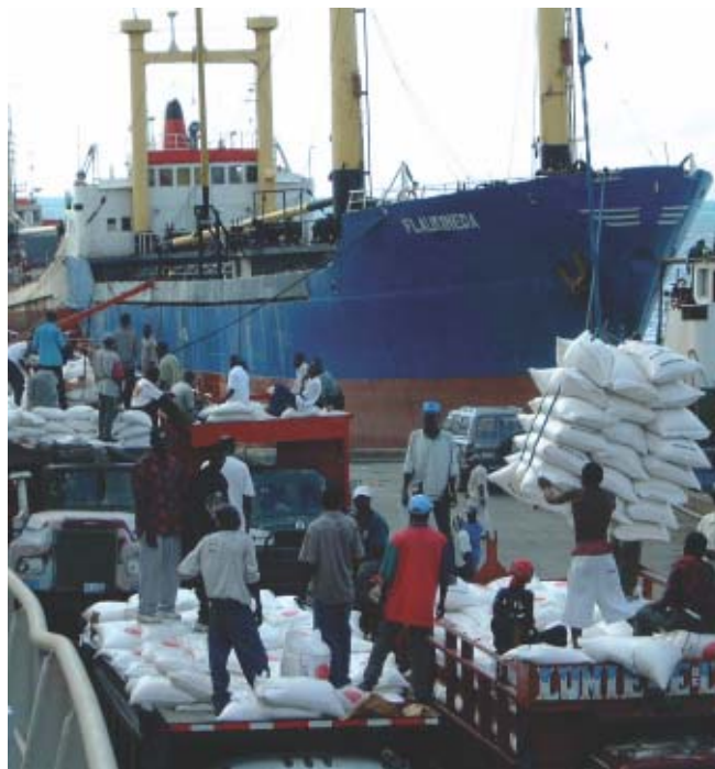
Haïti: Débarquement du riz de l'aide au port de Port-au-Prince

Le fonds constitué par le gouvernement du pays en voie de développement bénéficiaire en monnaie locale équivalent à un certain montant de la valeur de l'équipement fourni dans le cadre de la coopération financière. Ce fonds doit être utilisé en accord avec le gouvernement japonais pour le développement économique et social de ce pays bénéficiaire.