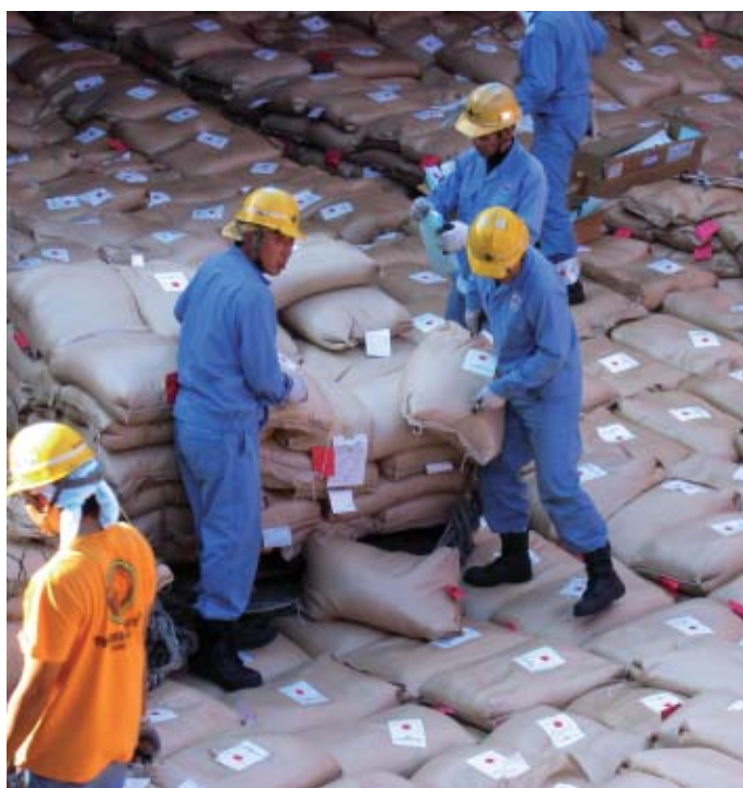
Riz de l'aide destiné au Bénin embarqué au port de Shimizu (Japon)