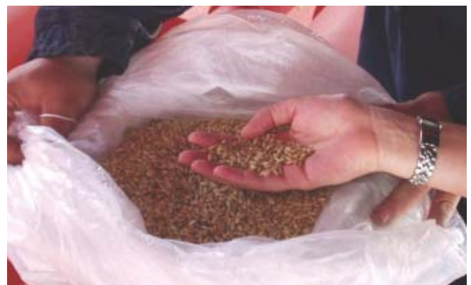
Jordania – Suministro de trigo para Jordania, cuya adquisición de divisas ha sido afectada por la guerra de Irak