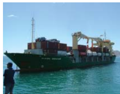
Timor-Leste – Un tanquero cargado de aceite ligero arribando al puerto de Dili