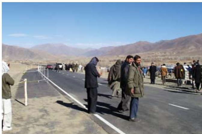
Afganistán – Vía principal entre Kandhar y Kabul construida por medio de la Cooperación No Reembolsable Tipo No Proyecto