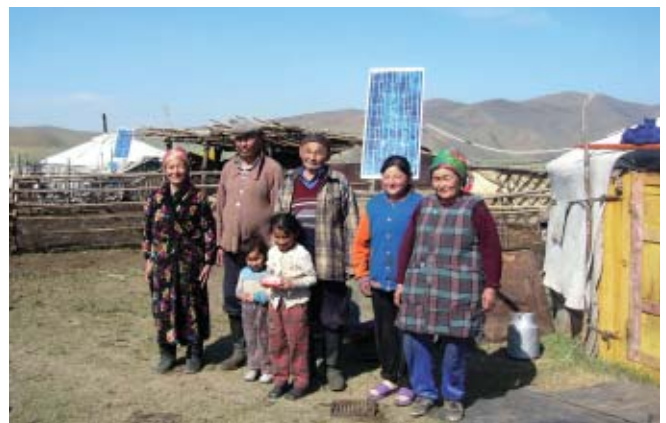
Mongolia – Generador de energía solar instalado en frente de una residencia tradicional

Los gobiernos de los países en desarrollo crean un fondo en moneda local en un banco equivalente al valor de los equipos adquiridos a través de la cooperación financiera no reembolsable. Posterior a la consulta con el gobierno de Japón, estos fondos pueden ser utilizados en forma planificada para el desarrollo económico local.