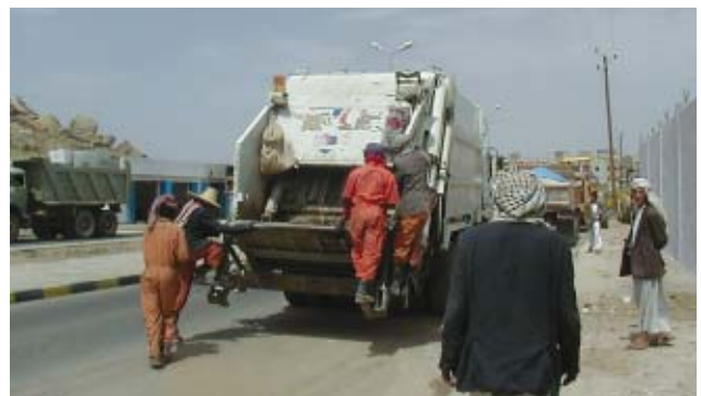
Vehículo de recolección de basura aún, en pleno uso

En el Año Fiscal 1999 fueron suministrados vehículos de gran y mediana escala para la recolección de basura a través del sistema cooperativo tipo no proyecto, habilitando las autoridades municipales para recolectar la basura sistemáticamente y contribuir al embellecimiento del patrimonio histórico. El mantenimiento de los vehículos ha sido también llevado a cabo apropiadamente y los vehículos continúan cumpliendo su trabajo en Sanaa.