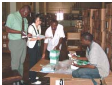
ザンビア—保健省の担当者と、到着した感染症治療キットを確認するJICS職員