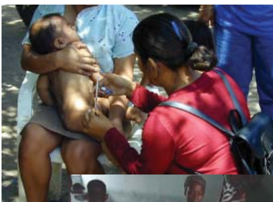
ニカラグア—乳幼児への予防接種