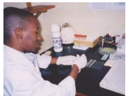
調達された HIV 検査キットは、主に VCT、病院での輸血の検査などに使用される

* VCT : Voluntary Counselling and Testing = 自発的カウンセリングおよび検査