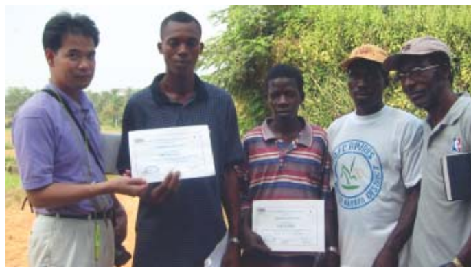
職業訓練学校の卒業証書を手にした生徒。証書には日英両国の国旗がデザインされている