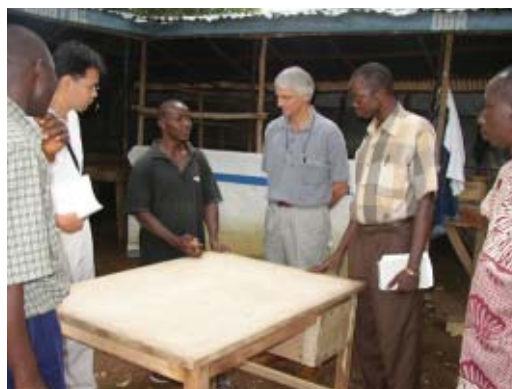
職業訓練学校の生徒から、制作した机についての説明を受けるJICS職員（左）と英国援助関係者（右）

1回目の視察の際には、日本が支援していることについてあまり知られていませんでしたが、2回目にはほとんどの地域で知られるようになっていました。また、行き交う人々、露店の数も増え、この支援が地域社会の復興や住民の安定した生活を保障することに貢献している様子がうかがえます。