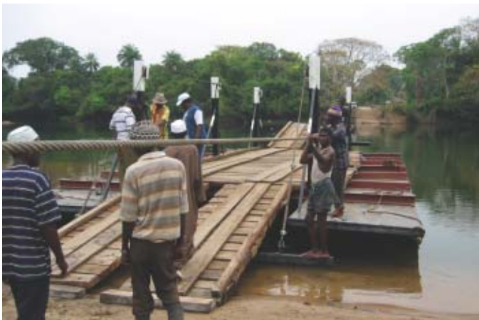
シエラレオネ—船が修理され、住民や物資の輸送が可能になった

JICSは2002年度より、開発途上国政府との契約に基づき、実施監理機関として、資金管理をはじめ、プログラムの形態に即して、活動の管理、支援などを行っています。