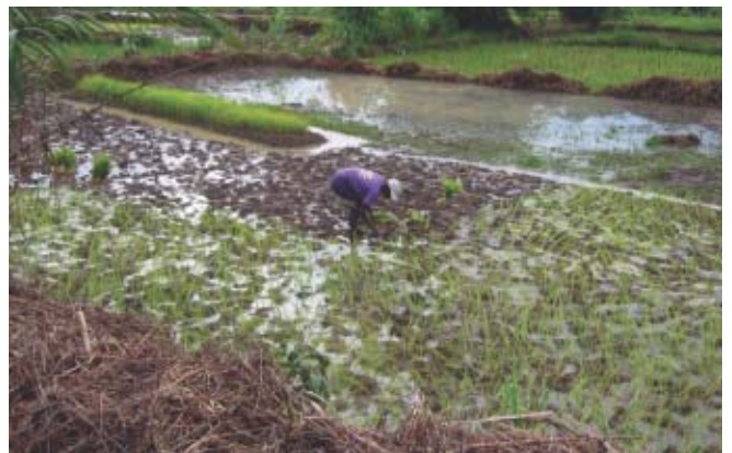
シエラレオネ—用水路が修復され、水田や養魚場に水が引かれた