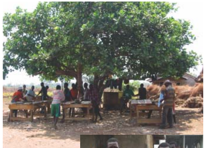
シエラレオネ—職業訓練の様子。生徒の多くが元兵士