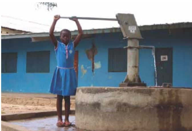
シエラレオネ—支援によって設置された井戸で水を汲む少女